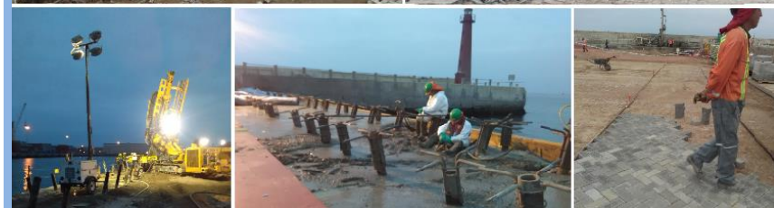
Etapa I – Proyecto de Construcción